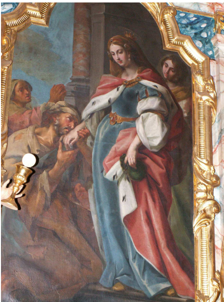
Bild: J.F. Fromiller 1739 (Bürgerspitalkirche Klagenfurt)

“ Ich habe euch immer gesagt, ihr müsst die Menschen froh machen“