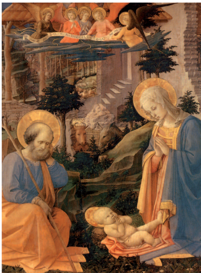
Die Anbetung des Kindes Fra Filippo Lippi um 1455

Einen Lichtblick hast du, o Gott, uns geschenkt, einen Augenblick in der Geschichte der Menschheit, einen Augenblick deiner Ewigkeit in dem du unser Leben erleuchtet, unsere Herzen gewärmt hast.